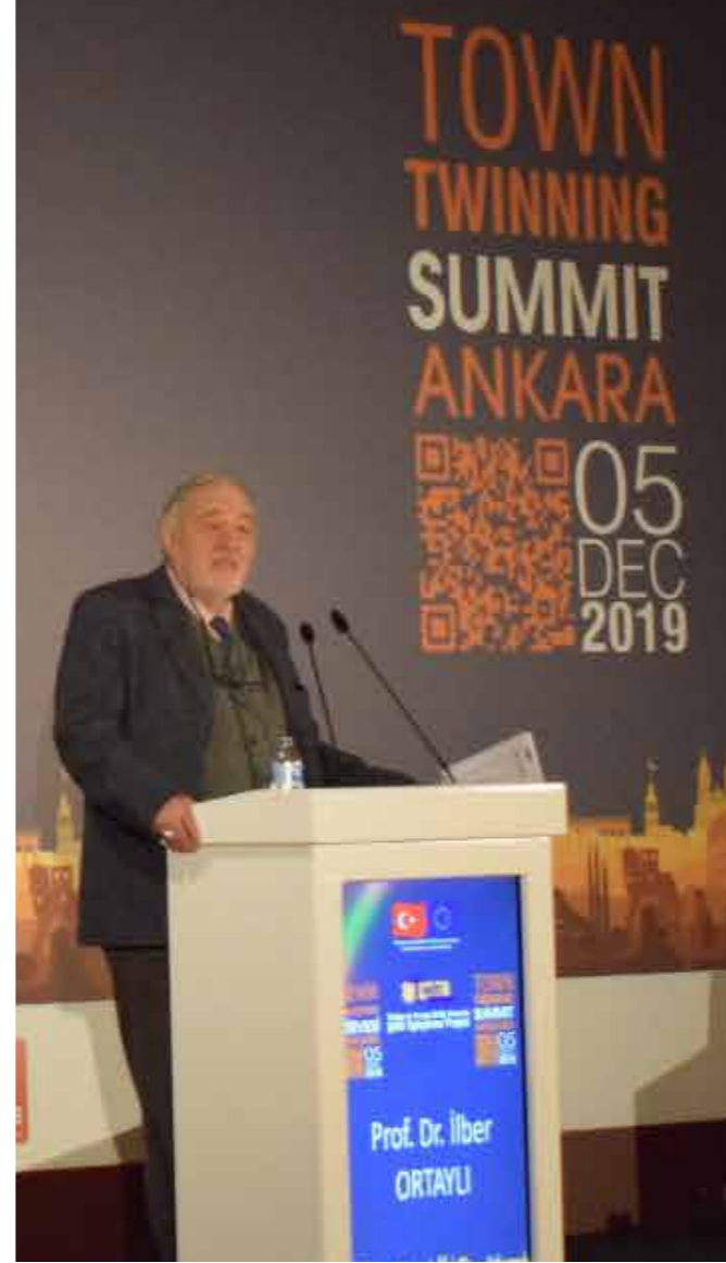
Prof. Dr. İlber ORTAYLI