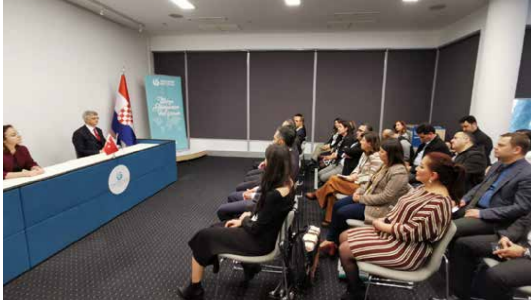
T.C. Zagreb Büyükelçisi Mustafa Babür HIZLAN ve TWIN Çalışma Ziyareti Heyeti

Şehir eşleştirme alanında aktif olarak faaliyet gösteren kurumlar ve iyi uygulama niteliğinde çalışmalar yürüten belediyeler, belediye birlikleri ve yerel yönetim ağları ile görüş alışverişinde bulunulması amacıyla 3-7 Şubat 2020 tarihleri arasında Hırvatistan'a çalışma ziyareti düzenlendi. TWIN çalışma ziyaretlerinin üçüncüsü olan bu etkinliğe katılan heyeti Dışişleri Bakanlığı AB Başkanlığı, Türkiye Belediyeler Birliği, Vilayetler Birliği, Çevre ve Şehircilik Bakanlığı Yerel Yönetimler Genel Müdürlüğü ve Türkiye'nin çeşitli illerinden TWIN Projesinin kapasite geliştirme eğitimlerine katılmış olan yerel yönetim temsilcileri oluşturuyordu.