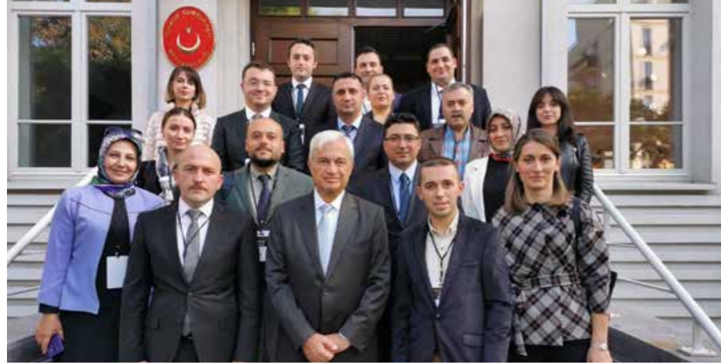
T.C. Varşova Büyükelçisi Tunç ÜĞDÜL, (ortada) ve TWIN Çalışma Ziyareti Heyeti

Şehir eşleştirme konusunda bilgi ve deneyimi artırmak amacıyla hazırlanan TWIN Çalışma Ziyaretleri Programının ikincisi 23-27 Eylül 2019 tarihleri arasında Polonya'da gerçekleşti. Beş gün süren çalışma ziyaretinin katılımcıları Dışişleri Bakanlığı AB Başkanlığı, Türkiye Belediyeler Birliği, Vilayetler Birliği, Çevre ve Şehircilik Bakanlığı Yerel Yönetimler Genel Müdürlüğü ve Türkiye'nin çeşitli illerinden gelen yerel yönetim temsilcilerinden oluşuyordu.