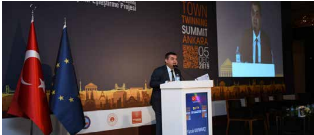
Faruk KAYMAKCI Dışişleri Bakan Yardımcısı ve Avrupa Birliği Başkanı, Büyükelçi

Oturumun son konuşmacısı olan Dışişleri Bakan Yardımcısı ve Avrupa Birliği Başkanı, Büyükelçi Faruk KAYMAKCI da 1990’da dünyada 10 milyonun üzerinde nüfusa sahip sadece 10 mega kent varken 2030’da bu sayının 43’ü bulacağını tahmin edildiğini aktardı. Böyle bir öngöründe, AB’ye katılım sürecinde Türkiye’nin yerel düzeyde idari kapasitenin güçlendirilmesinin önemini vurgulayan KAYMAKCI “Bu nedenle Türkiye’deki ve AB’ye üye ülkelerdeki yerel yönetimler arasında bilgi ve deneyim paylaşımını sağlayacak kalıcı köprülerin kurulması için çalışmalarımız kararlılıkla devam edecek” dedi.