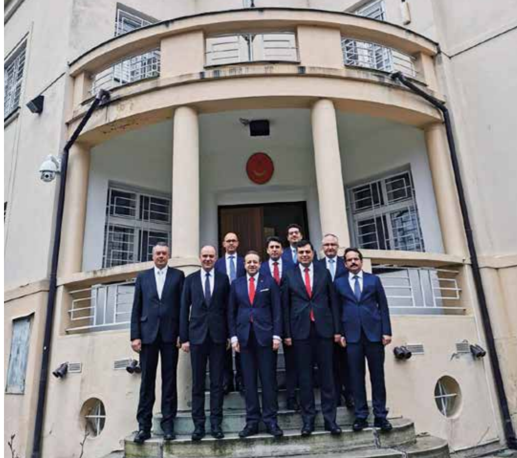
T.C. Prag Büyükelçisi Egemen BAĞIŞ (ortada) ve TWIN Çalışma Ziyareti Heyeti

Program, TWIN heyetinin Türkiye Cumhuriyeti Prag Büyükelçiliği ziyaretiyle başladı. Ziyarete Büyükelçi Egemen BAĞIŞ, Türkiye-Çekya ticari ve kültürel ilişkileri ile Çekya'nın yerel yönetim yapısı hakkında heyeti bilgilendirdi.