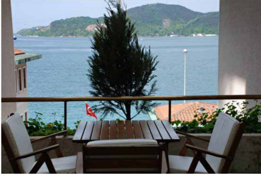
İstanbul Vilayetler Evi balkon manzarası

Tesiste söz konusu bu hizmetler 23 personel ile verilmekte olup, uygulanan konaklama fiyatları aşağıda belirtilmiştir.