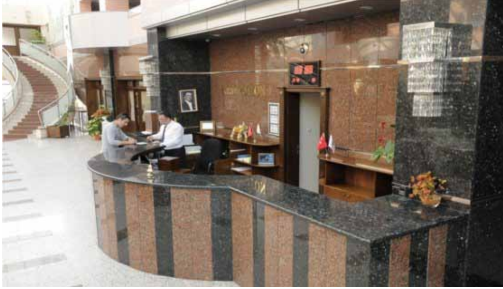
İzmir Vilayetler Evi resepsiyon

Hizmet Tanımı ve Birimi: Tesiste konaklama, alakart ve toplu yemek hizmetleri verilmektedir.