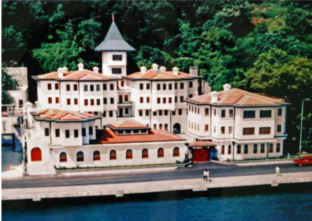
İstanbul Vilayetler Evi dışardan genel görünümü

Mülkiyeti Vilayetler Hizmet Birliği Başkanlığına ait tesis 1988 yılında restore edilerek, şirketimiz tarafından işletilmek üzere hizmete açılmıştır.