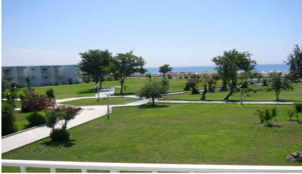
Ayvalık Eğitim ve Dinlenme Tesisi bahçe görünümü

Bakım onarım ihtiyaçları: Deniz kıyısında olmasından dolayı hemen hemen her sezon öncesi tadilat ve onarım ihtiyacı gerekmektedir.