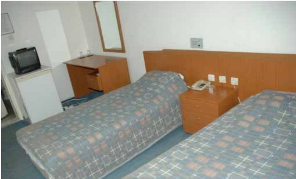
Vali Erdoğan Şahinoğlu Eğitim Tesisi standart oda görünümü

Otel Bölümü: 4 Adet Duple Yatak, 17 Adet Tek Yataklı oda, 14 Adet 2 Yataklı olmak üzere toplam 35 oda 49 yatak kapasiteli odalarda; Mini bar, gardirop, çalışma masası, TV ve telefon mevcuttur.