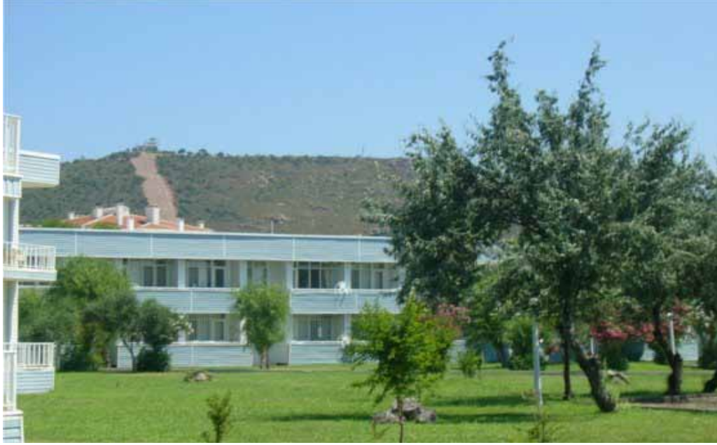
Ayvalık Eğitim ve Dinlenme Tesisi genel görünüm

Hizmet Tanımı ve Birimi: Kamptan yararlanmak isteyen mensupların bağlı oldukları il özel idarelerine yaptıkları başvurularının, birlik merkezine bildirilmesinin ardından, Birlik tarafından adlarına düzenlenen kamp katılma belgesi ile hizmet almaktadırlar.