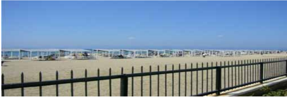
Ayvalık Eğitim ve Dinlenme Tesisi kumsal görünümü

Tesis Otomasyon Sistemi: 2007 döneminde otel programı kurulmuş, 2008 yılından itibaren kredi kartı uygulamasına başlanmıştır. Ayrıca; 2010 kamp sezonunda kredi kartına taksit yapılması kararı alınmıştır.