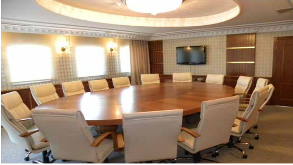
Merkez Vilayetler Evi Vip Toplantı Salonu görünümü

Salonlar: Merkez Vilayetler Evinde; 70 kişilik alakart yemek salonu, TV ve okuma salonları, bay-bayan kuaför, VIP yemek salonu, VIP toplantı salonu, Kafeterya bölümleri mevcuttur.