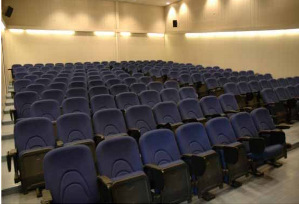
Vali Erdoğan Şahinoğlu Eğitim Tesisi konferans salonu görünümü

Konferans Bölümü: 175 kişilik oturma kapasitesi, projeksiyon ve ses düzeni mevcuttur.