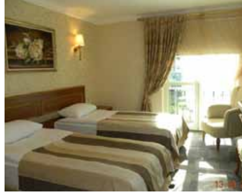
Merkez Vilayetler Evi standart oda görünümü

Zemin katta kafe, 1.kat ve çatı katında servis hazırlık ünitelerinin bulunduğu tesisimizde 13 araçlık kapalı ve 14 araçlık açık otoparkı bulunmaktadır.