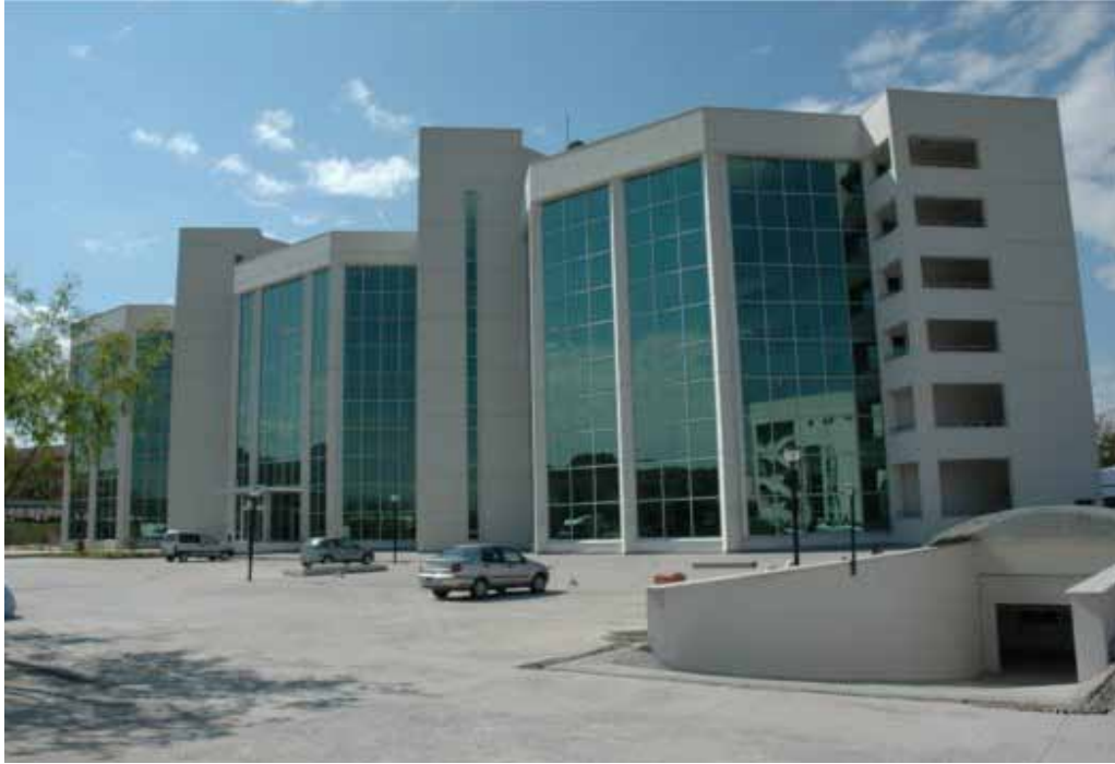
Vali Abdülkadir Aksu Vilayetler Evi genel görünümü

Mülkiyeti Maliye Hazinesine ait, İçişleri Bakanlığına tahsisli bina, İdari bina ve sosyal tesis olarak 2 bölümden ibarettir. İdari binaya 2005 yılında AREM Merkezi taşınmış, daha sonra 2006 yılında da Eğitim Dairesi Başkanlığı taşınmıştır.