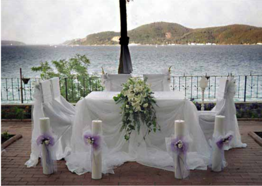
İstanbul Vilayetler alt bahçe manzarası