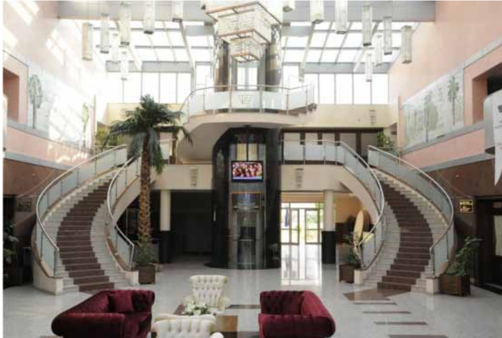
İzmir Vilayetler Evi Lobi görünümü

Restoran Bölümü: 200 ve 300 kişilik 2 adet düğün salonu, kışın 160 yazın 200 kişilik restoran bulunmaktadır. Alakart hizmeti verilen restoran salonu ön bahçeye doğru camlı bölme ile genişletilerek, hem yaz hem kış hizmet verebilen ferah bir mekân haline getirilmiştir. Ayrıca aynı mekânın masa ve sandalyeleri de 2010 yılı içerisinde yenilerek daha kaliteli hizmet verilmesi hedeflenmiştir.