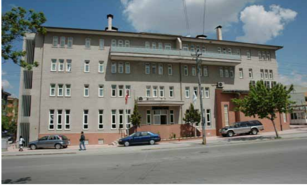
Vali Erdoğan Şahinoğlu Eğitim Tesisi genel görünümü

Mülkiyeti Vilayetler Hizmet Birliği Başkanlığına ait tesis, 1998 yılında Eğitim amaçlı ve misafirhane olarak hizmete girmiştir.