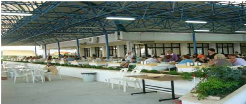
Ayvalık Eğitim ve Dinlenme Tesisi Restoran görünümü

Misafirlere sabah kahvaltısı, öğlen ve akşam yemeği, masalara servis yapılarak sunulmaktadır. Ayrıca nevresim takımı verilmektedir.