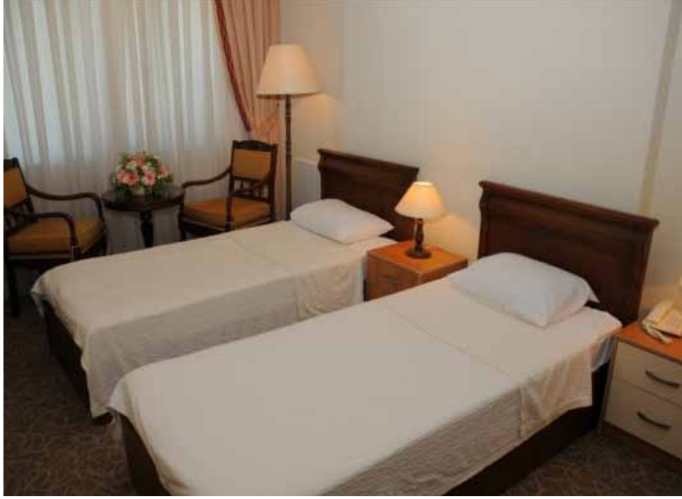
İzmir Vilayetler Evi standart iki kişilik oda görünümü

Restoran Bölümü: 200 ve 300 kişilik 2 adet düğün salonu, kışın 160 yazın 200 kişilik restoran bulunmaktadır. Alakart hizmeti verilen restoran salonu ön bahçeye doğru camlı bölme ile genişletilerek, hem yaz hem kış hizmet verebilen ferah bir mekân haline getirilmiştir. Ayrıca aynı mekânın masa ve sandalyeleri de 2010 yılı içerisinde yenilerek daha kaliteli hizmet verilmesi hedeflenmiştir.