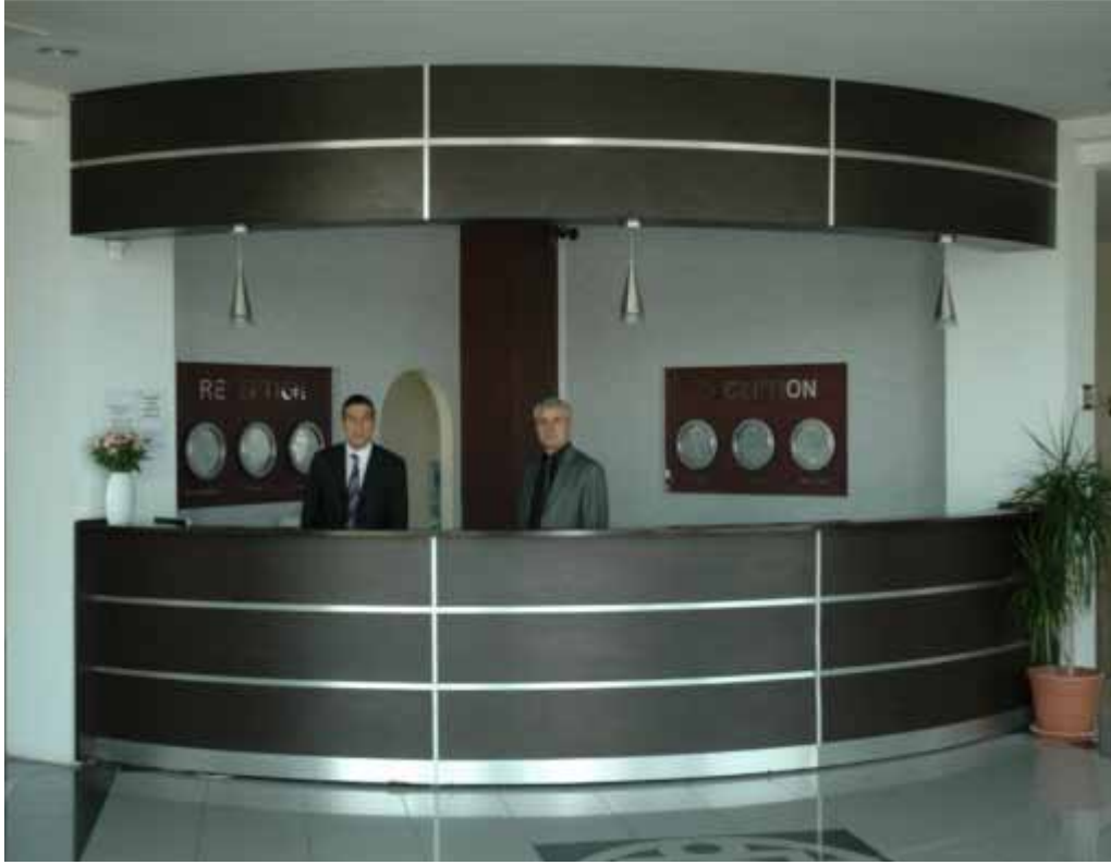
Vali Abdülkadir Aksu Vilayetler Evi resepsiyonu

Hizmet Tanımı ve Birimi: Tesiste konaklama hizmeti verilmektedir.