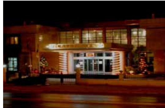
İzmir Vilayetler Evi dışardan genel görünümü