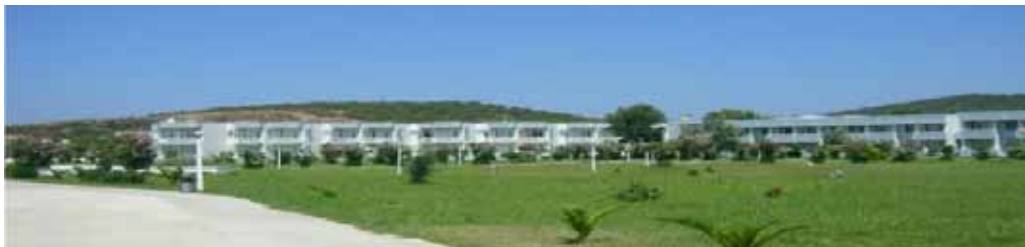
Ayvalık Eğitim ve Dinlenme Tesisi genel görünüm

Mülkiyeti İçişleri Bakanlığına ait tesis, 1987 yılından itibaren şirketimiz tarafından işletilerek, Haziran-Eylül yaz döneminde kamp olarak hizmet vermektedir.