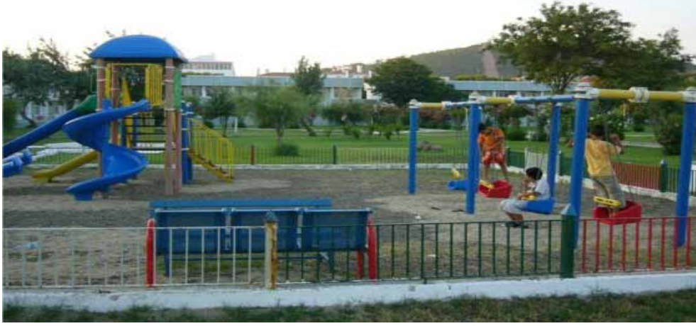
Ayvalık Eğitim ve Dinlenme Tesisi çocuk parkı görünümü