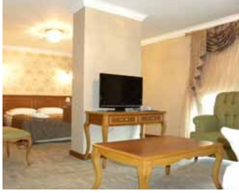
Merkez Vilayetler Evi duble yataklı oda görünümü