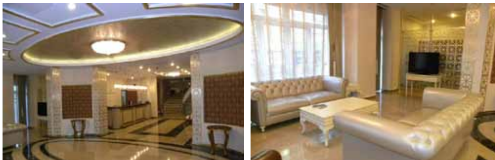
Merkez Vilayetler Evi resepsiyon ve Lobi görünümü

Otel Bölümü: 3 adet Süit oda, 13 adet duble yataklı oda, 14 adet tek kişilik, iki yataklı oda olmak üzere toplam 30 oda ve 42 yatak kapasiteli odalarda; Mini bar, Gar dolap, çalışma masası, klima, TV, internet, dâhili telefon mevcuttur.