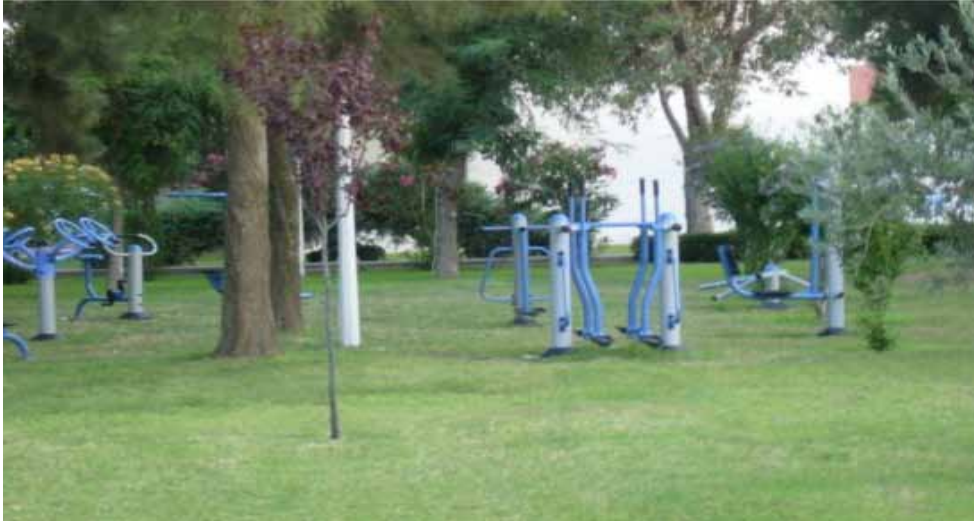
Ayvalık Eğitim ve Dinlenme Tesisi bahçe ve fitnes aletleri görünümü