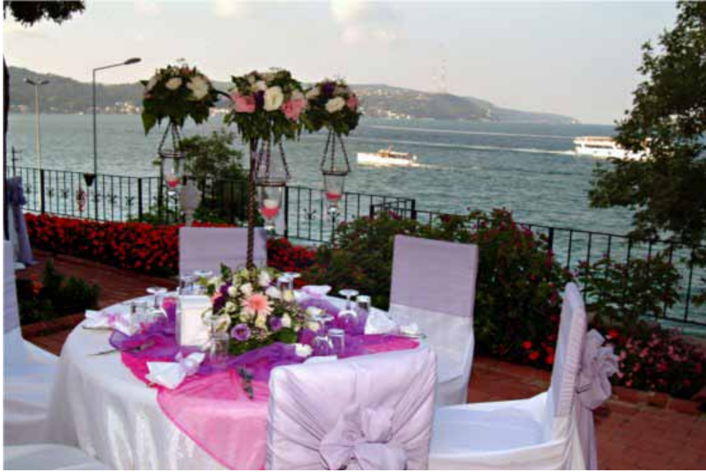
İstanbul Vilayetler Evi balkon görünümü

Otel Bölümü: 18 adet duble yataklı, 4 adet tek yataklı, 2 adet 2 yataklı olmak üzere toplam, 34 oda 64 yatak kapasiteli odalarda; mini bar, gardırop, TV ve telefon mevcuttur. Otel bölümünün haricinde 3 adet tahsisli oda bulunmaktadır.