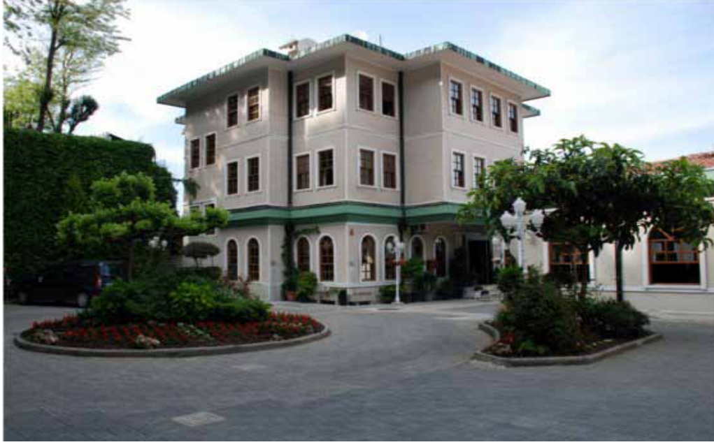
İstanbul Vilayetler Evi dışardan genel görünümü

2002 yılında kısmi bir tefriş ve tesisat yenilenmesi yapılan tesiste 1988 yılından itibaren ciddi bir tadilat ve yenileme yapılmamıştır. İhtiyaç duyulan yenileme ve tadilat işlerinin çalışmalarına 2009 yılında başlanmış, proje hazırlıkları büyük ölçüde tamamlanmıştır. 2010 yılında restorasyon ve güçlendirme ihalesi yapılmıştır.