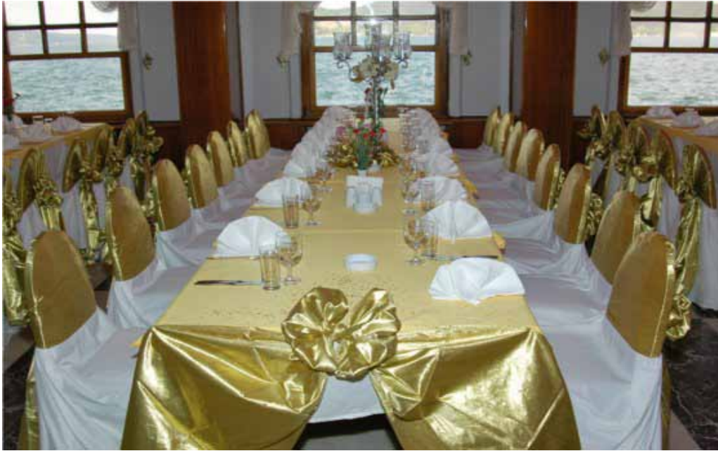
İstanbul Vilayetler Evi yemek salonu görünümü

Hizmet Tanımı ve Birimi: Tesisimizde konaklama, alakart ve toplu yemek hizmetleri verilmektedir.