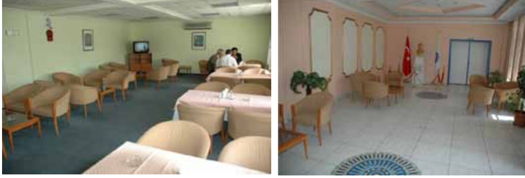
Vali Erdoğan Şahinoğlu Eğitim Tesisi kafeterya görünümü

Kafeterya Bölümü: 35 kişi oturma kapasiteli olup, tesiste konaklayan misafirlerimize sadece kahvaltı, soğuk ve sıcak içecek hizmeti sunulmaktadır.