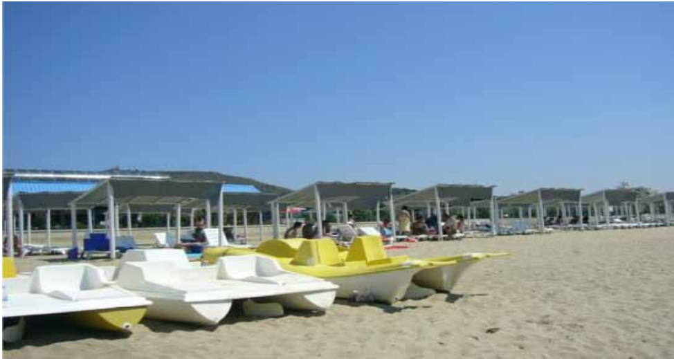
Ayvalık Eğitim ve Dinlenme Tesisi kumsal görünümü