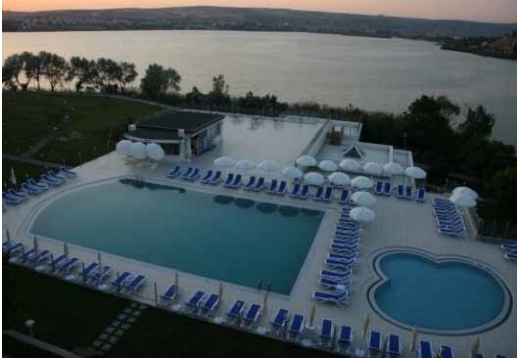
Vali Galip Demirel Ankara Vilayetler Evi yüzme havuzu