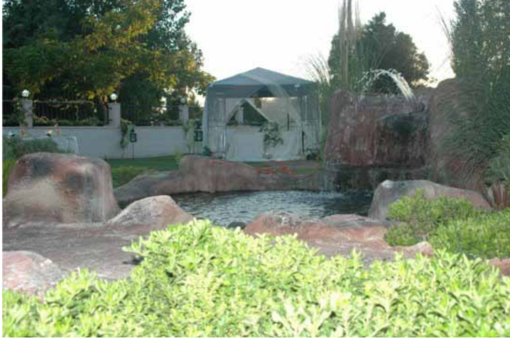
İzmir Vilayetler Evi bahçe görünümü

Lobi içinde 20 kişilik kafe bölümü mevcuttur.