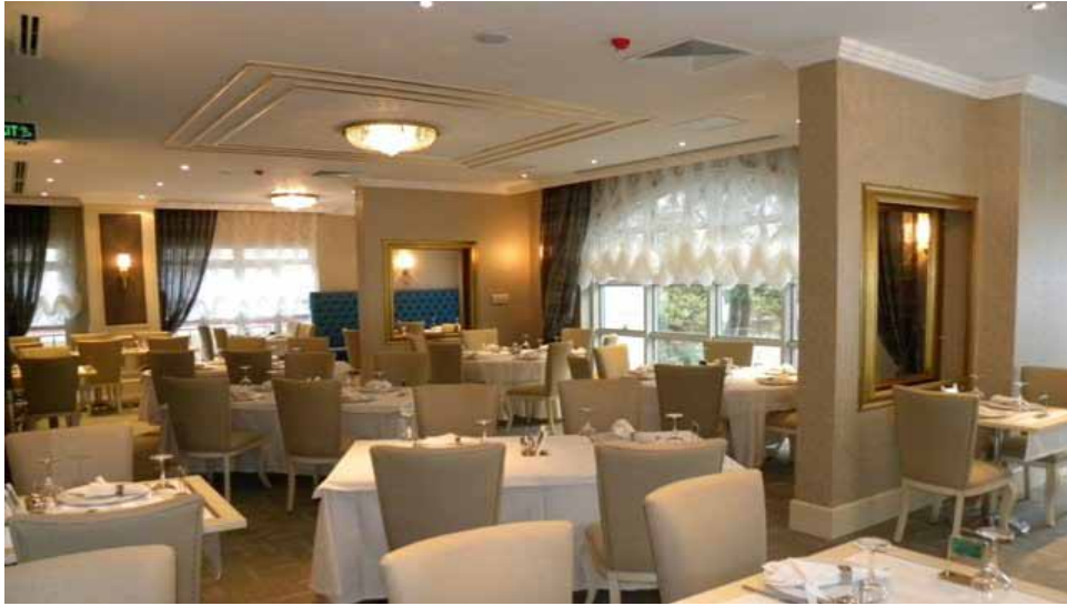
Merkez Vilayetler Evi Yemek Salonu görünümü

Salonlar: Merkez Vilayetler Evinde; 70 kişilik alakart yemek salonu, TV ve okuma salonları, bay-bayan kuaför, VIP yemek salonu, VIP toplantı salonu, Kafeterya bölümleri mevcuttur.