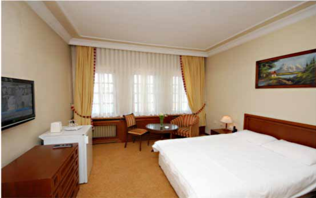
İstanbul Vilayetler Evi standart oda görünümü

Otel Bölümü: 18 adet duble yataklı, 4 adet tek yataklı, 2 adet 2 yataklı olmak üzere toplam, 34 oda 64 yatak kapasiteli odalarda; mini bar, gardırop, TV ve telefon mevcuttur. Otel bölümünün haricinde 3 adet tahsisli oda bulunmaktadır.