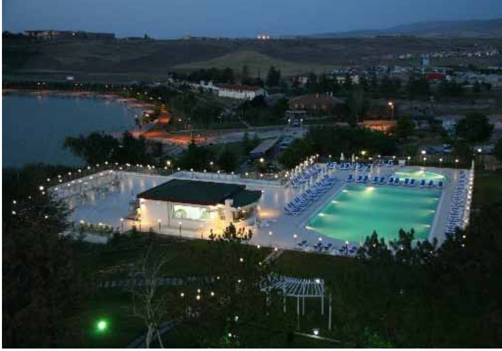
Vali Galip Demirel Ankara Vilayetler Evi havuz ve bahçesinin gece görünümü