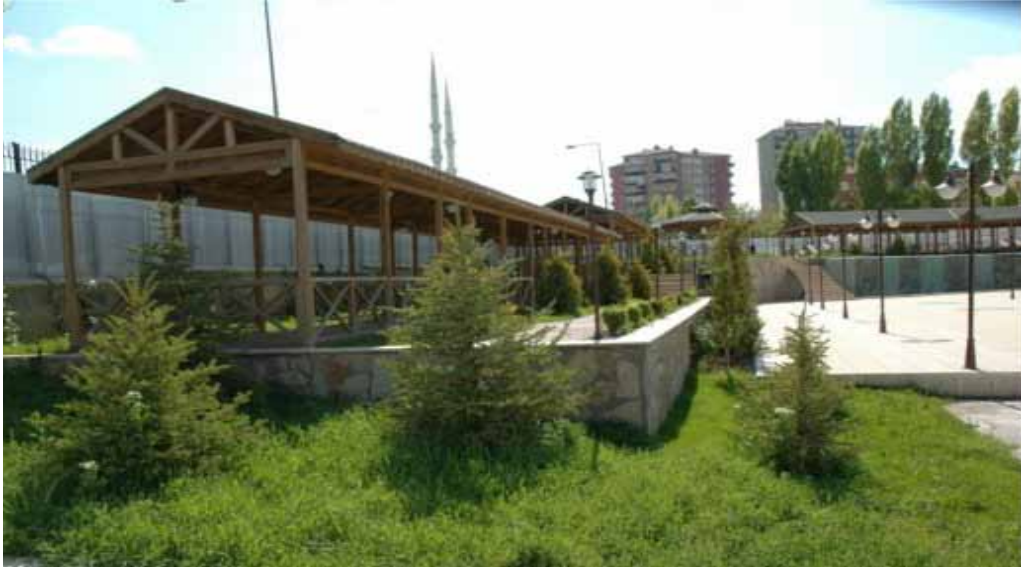
Vali Abdülkadir Aksu Vilayetler Evi genel görünümü

Ayrıca, 1 Ocak 2010 tarihi itibarıyla alınan karar ile tesiste verilen tabldot yemek hizmeti kaldırılmıştır.