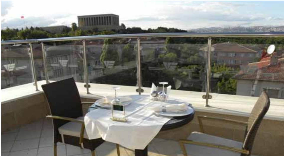
Merkez Vilayetler Evi Anıtkabir manzaralı teras görünümü