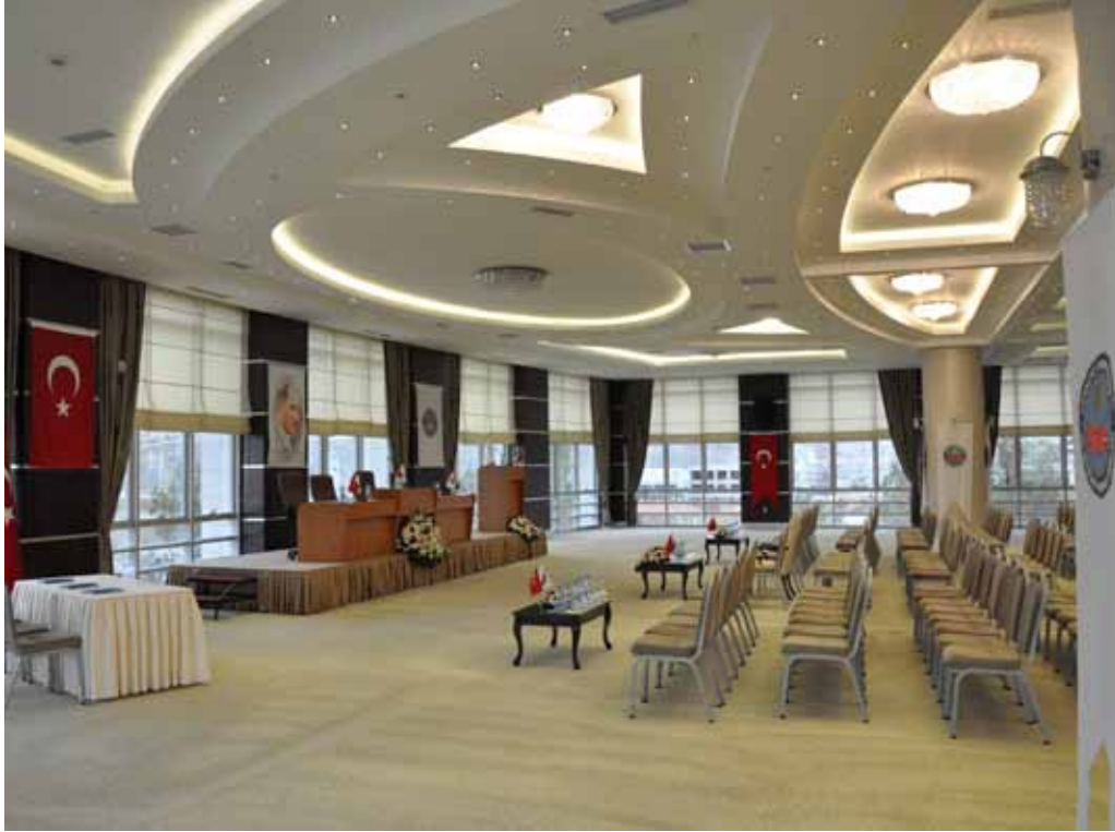
Vali Galip Demirel Ankara Vilayetler Evi Çok Amaçlı Salon görünümü