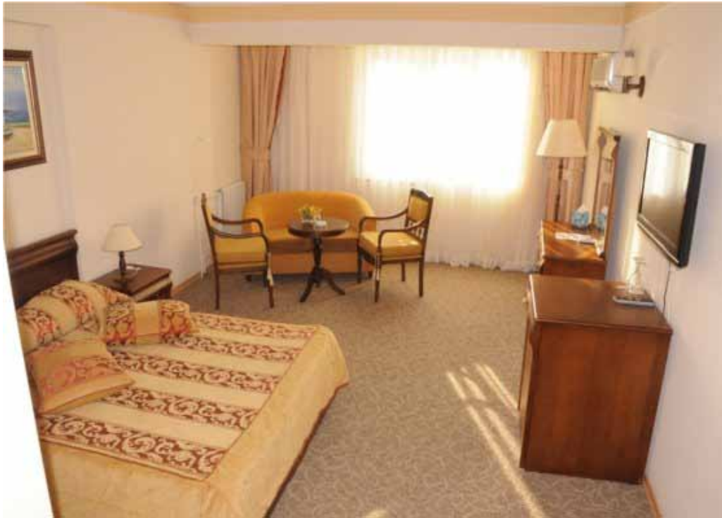
İzmir Vilayetler Evi standart duble oda görünümü

Otel Bölümü: 4 adet duble yataklı, 9 adet duble + tek yataklı, 3 adet üç ayrı tek yataklı, 2 adet iki ayrı tek yataklı oda olmak üzere toplam, 18 oda 48 yatak kapasiteli mevcudu ile hizmet veren tesisimizde, yoğun talep olması nedeniyle fazla kullanılmayan konferans salonu ve VIP Dinlenme Salonu, 2'si süit oda olmak üzere toplam 5 oda haline getirilmiş, böylece toplam 23 oda 54 yatak kapasitesine kavuşulmuştur . Odaların her birinde; mini bar, klima, gardırop, çalışma masası, 82 ekran LCD TV, çelik laptop kasası, telefon ve kablosuz internet bulunmaktadır.