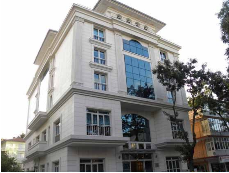
Merkez Vilayetler Evi dışardan genel görünüm

Şirket tarafından işletilen Merkez Vilayetler Evinde, otel ve restoran hizmeti verilerek mensupların şehir merkezinde bir tesisimizin olması yönündeki istekleri de yerine getirilmiştir.