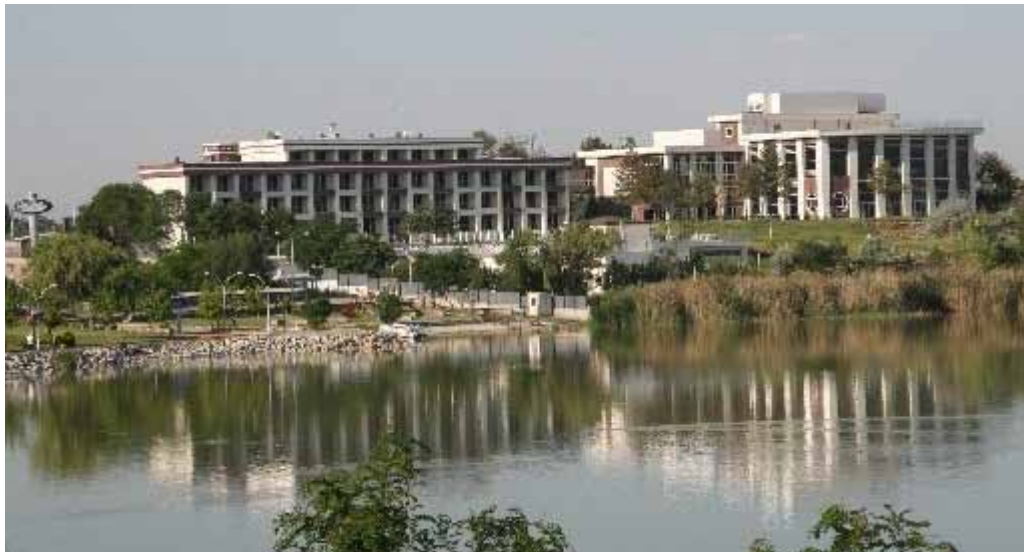
Vali Galip Demirel Ankara Vilayetler Evinin genel görünümü (Gölbaşı)

İhtiyaç duyulan onarım ve tadilat nedeniyle, Eylül 2006 tarihinde yeniden yapılandırılmak üzere inşaatına başlanan Vali Galip Demirel Ankara Vilayetler Evi, 14 Temmuz 2009 tarihinden itibaren yeniden hizmet vermeye başlamıştır.