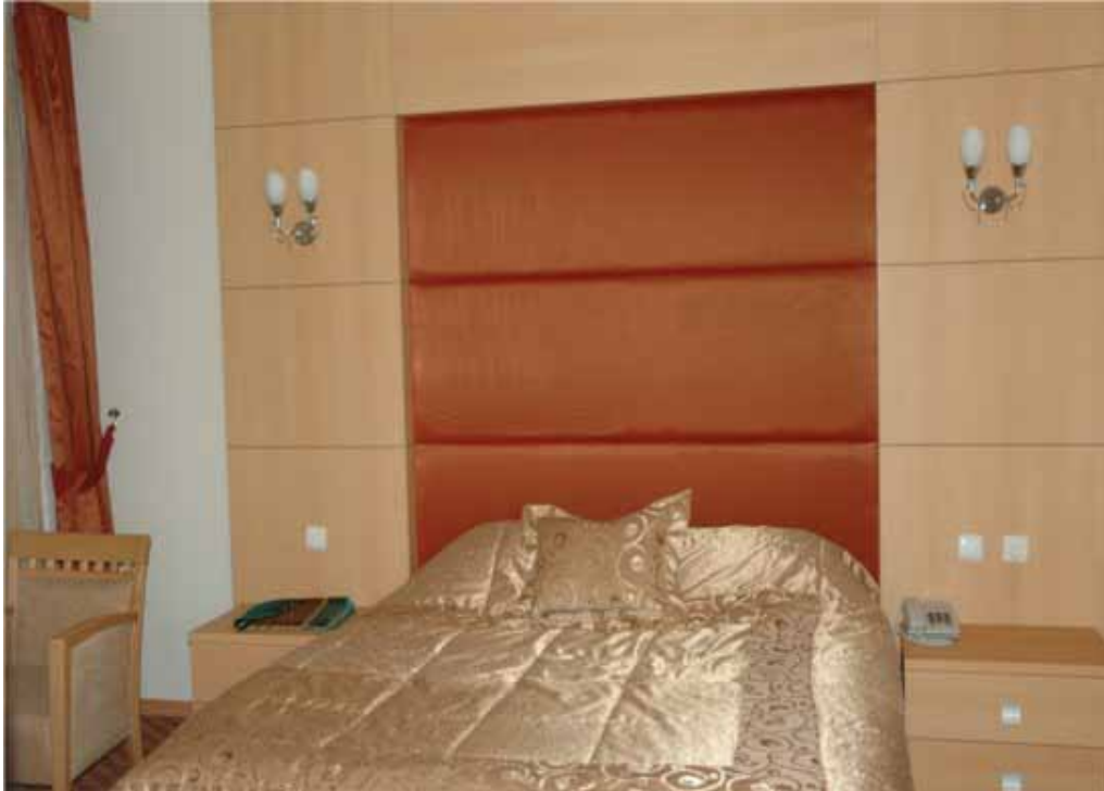
Vali Abdülkadir Aksu Vilayetler Evi standart oda görünümü

Hizmet Tanımı ve Birimi: Tesiste konaklama hizmeti verilmektedir.