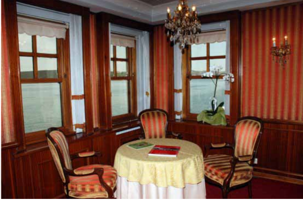
İstanbul Vilayetler Evi iç görünümü

Salonlar: 180 kişilik yemek salonu, 250 kişilik avlu bahçe, 250 kişilik teras bahçe, 80 kişilik alt bahçe ve 70 kişilik kafeterya bulunmaktadır.