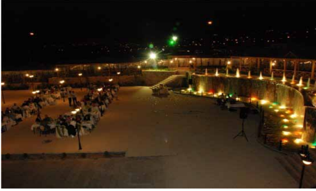
Vali Abdülkadir Aksu Vilayetler Evi bahçesi kış manzarası

Ayrıca, 1 Ocak 2010 tarihi itibarıyla alınan karar ile tesiste verilen tabldot yemek hizmeti kaldırılmıştır.